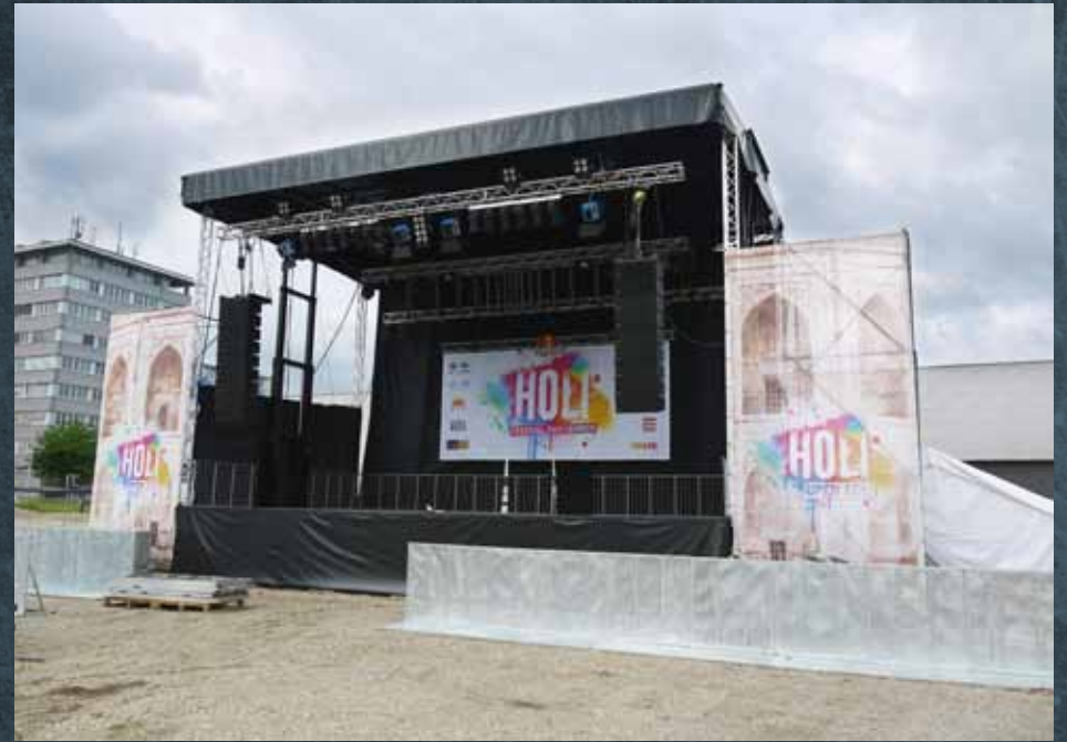
Smart Stage 120