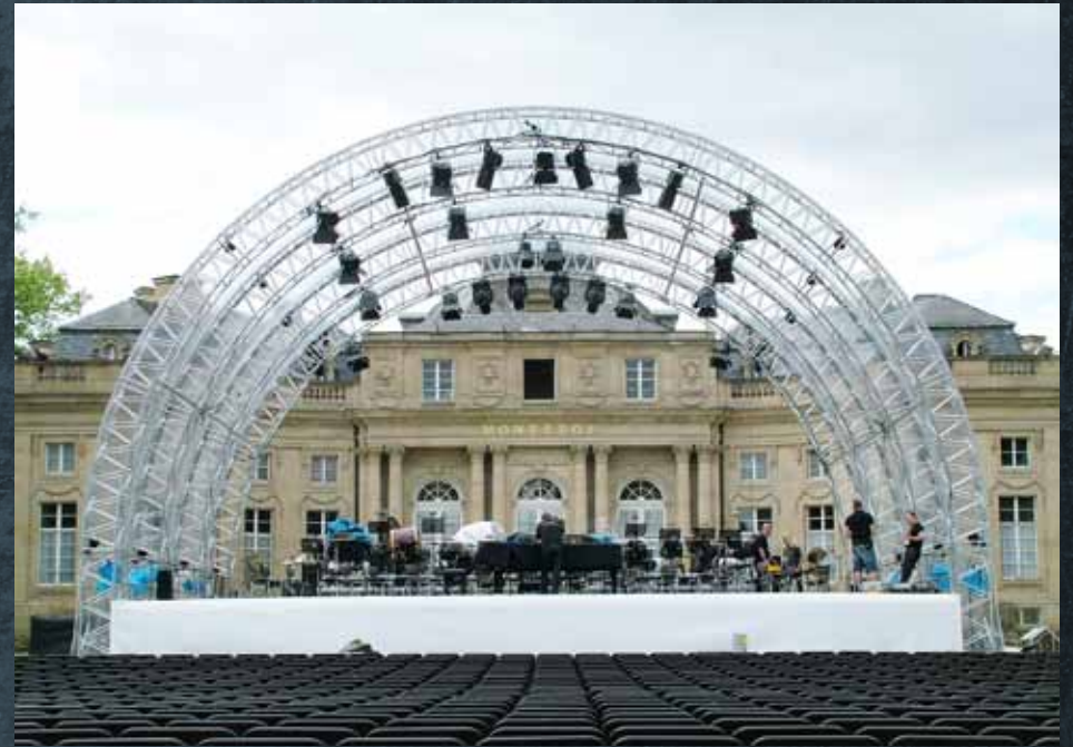
RBB SB 62