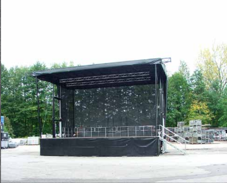
Smart Stage 80